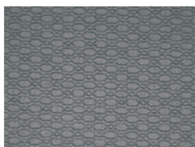
SP Premium: 全表面无可见的变形的图案

由于很好的偏析控制，使得Superplast Premium不仅可应用于简单图形的蚀纹，还适用于几何图案等更复杂的蚀纹应用（例如品牌logo等）。